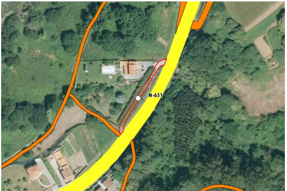
PNOA máxima actualidad