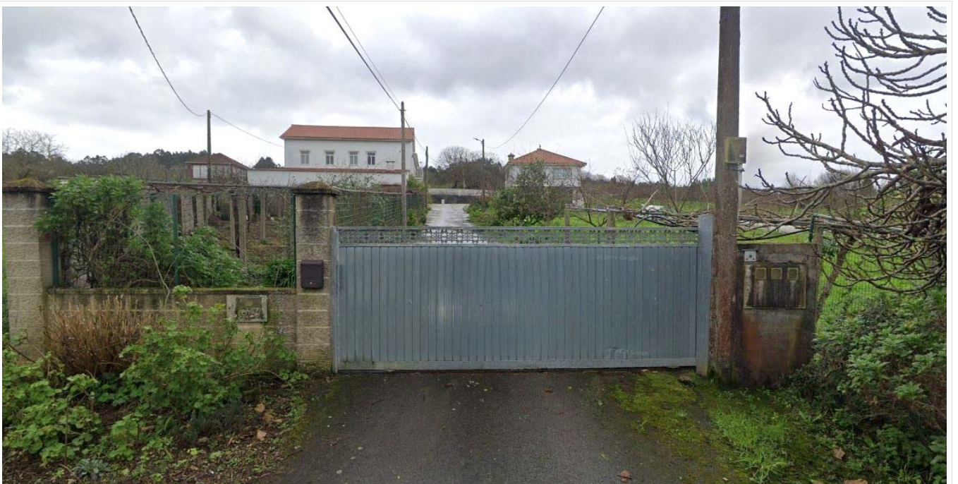
Imaxe Street View