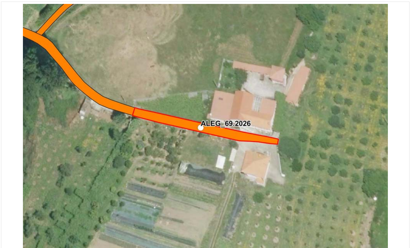
PNOA máxima actualidad