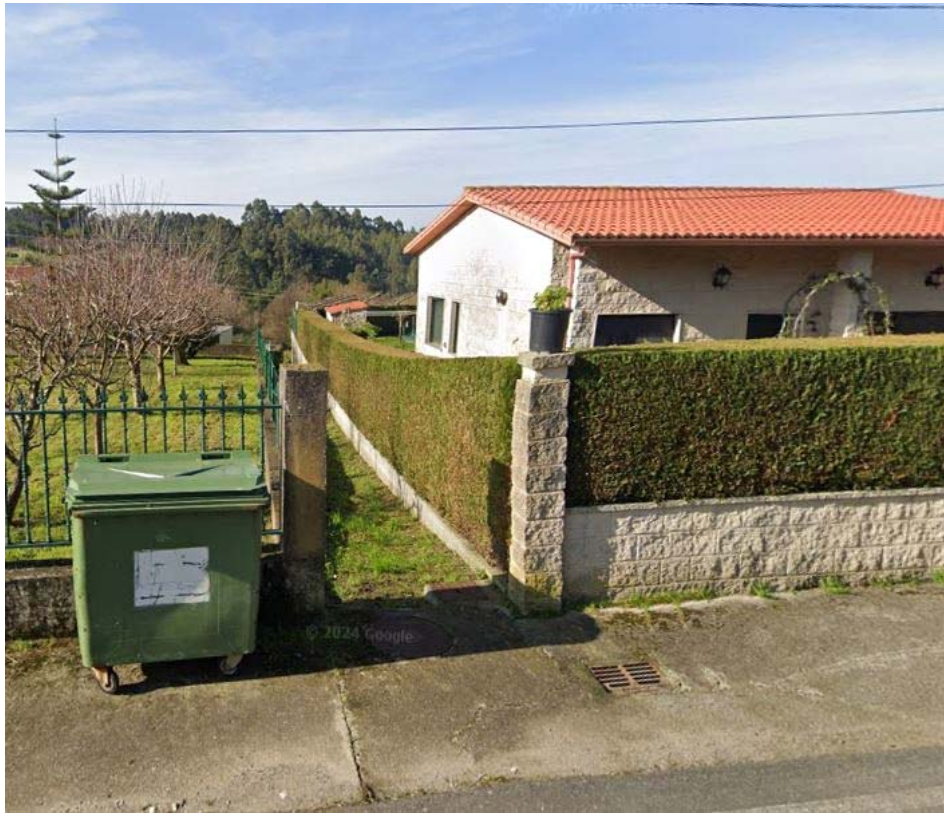
Imaxe Street View (sur)