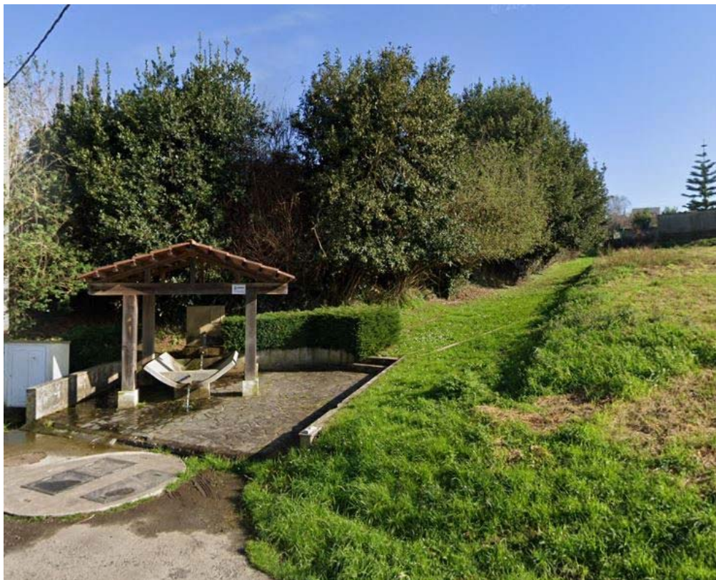
Imaxe Street View (norte)