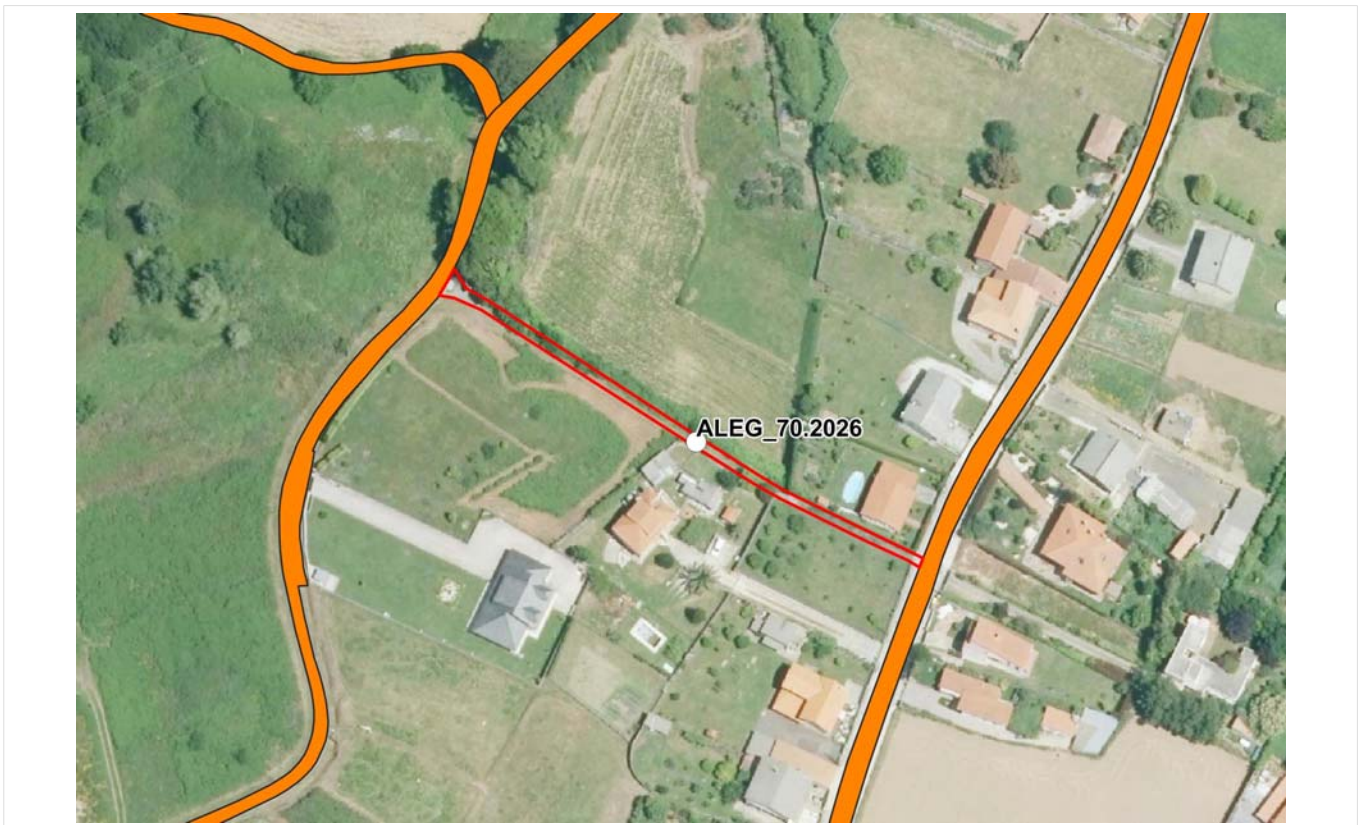
PNOA máxima actualidade